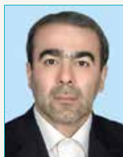
سیدلطف اله مساوات ۱۰ پیشنهاد