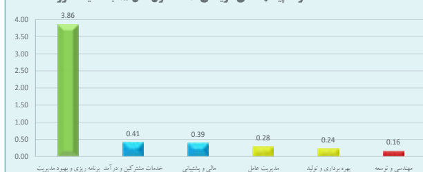
سرانه پیشنهادهای دریافتی ۶ ماهه اول سال ۹۵ به تفکیک حوزه ها

اگر ایده ای به نظرتان پیچیده می رسد، احتمال دهید در مورد آن اشتباه کرده اید، همه ایده های خوب به طور شگفت آوری ساده هستند