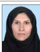
رتبه ۲ - امتیاز ۳۳ ماهورز پرویزی (دوربین عکاسی)