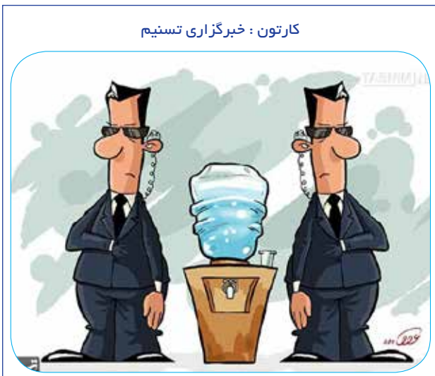
کارتون: خبرگزاری تسنیم

پس قدر آب این عنصر حیات بخش را باید دانست. آب ماده ای است که حیات بدون آن میسر نیست، نکته جالب این که همه فکر میکنند بیشترین میزان آب بدن در داخل خون که مایع است وجود دارد، در صورتیکه تنها ۵٪ آب در خون موجود است و بیشترین میزان آب در داخل سلولها می باشد. اگر آب نباشد هیچ یک از فعالیت های شیمیایی در بدن صورت نمیگیرد. نیازهای سلول برای جذب مواد مفید و دفع مواد زائد به آب بستگی