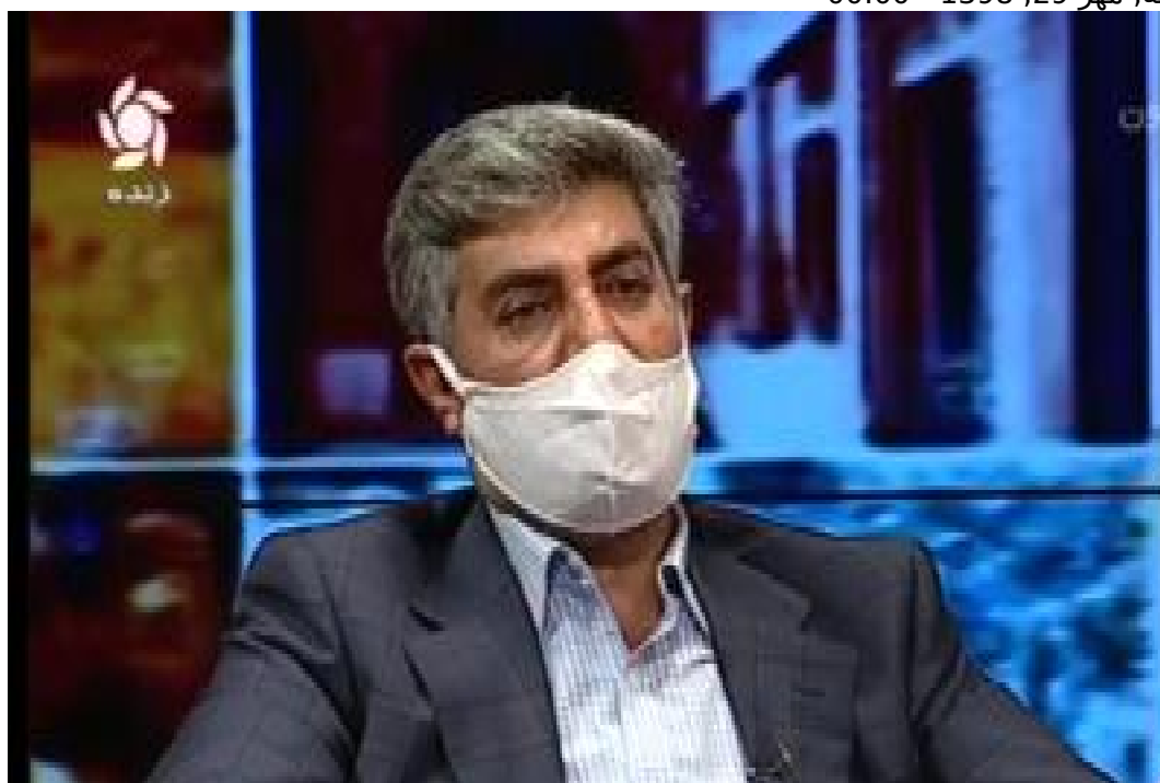
تصویر صفحه اول:

تاریخ ثبت خبر: دوشنبه، مهر 29، 1398 - 00:00